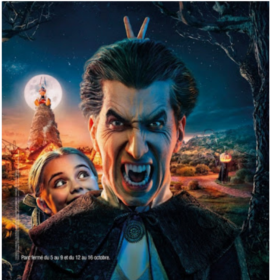
Affiche "peur sur le parc" pour les 10 ans du parc Astérix

La fête de Samain, célébrée en Irlande et en Écosse, a progressivement été supplantée par la Toussaint introduite le 1er novembre par l'Église catholique aux environs du VIIIe siècle.