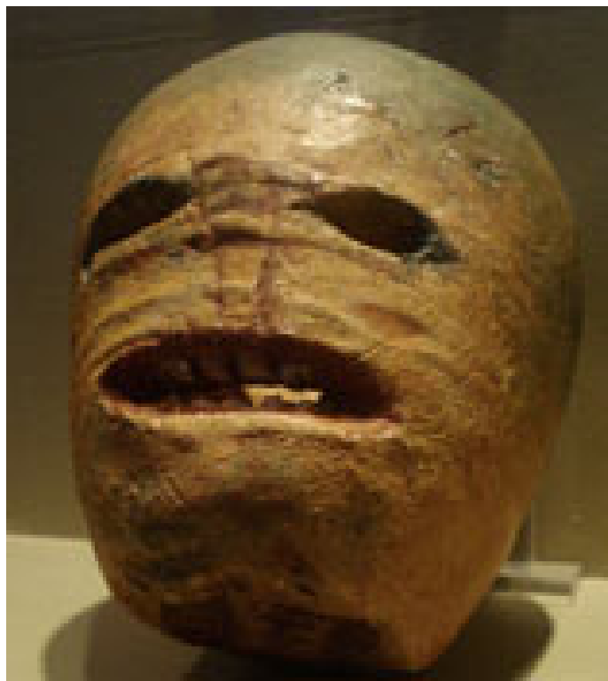
Jack'O'Lantern sculpté dans un navet, début XXe, museum of country life

Le noir et l'orange sont généralement associés à Halloween. Le orange est un symbole de force et d'endurance et, avec le brun et l'or, est associé à la récolte et à l'automne. Le noir est généralement un symbole de mort et des ténèbres, et rappelle qu'Halloween était autrefois une fête qui marquait la frontière entre la vie et la mort.