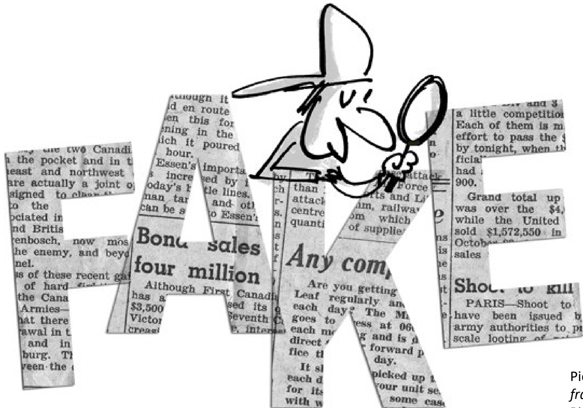
Pierre Botherel, Elle est fraîche ton info ? , 2019