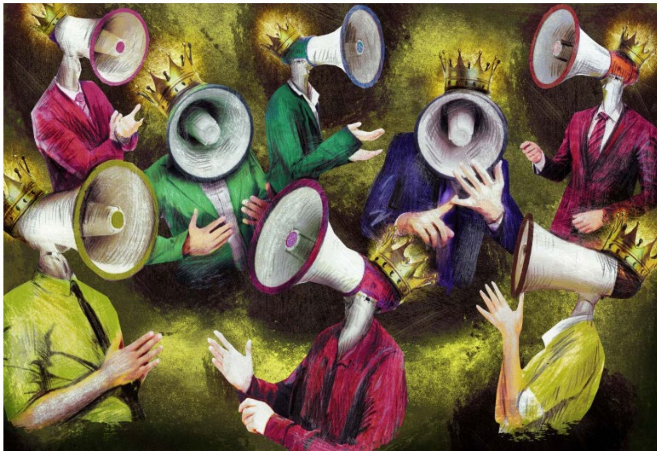
Ale + Ale, Mégaphones , 2019 © Ale + Ale