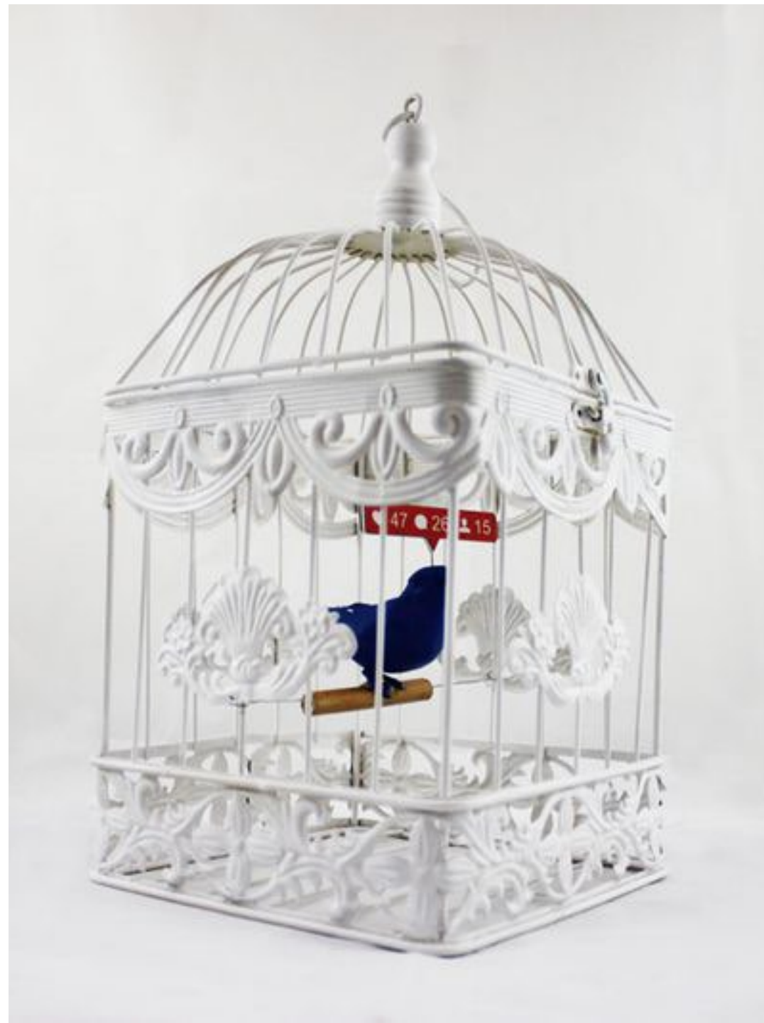
Encoreunestp, « #NotiTweety 2.0 », 2020.