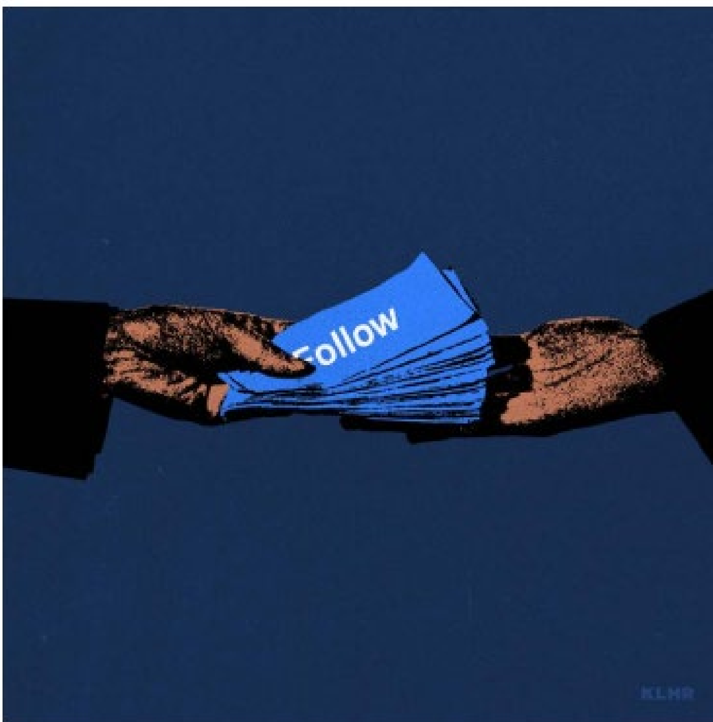
Kevin Lau, Social Currency (Monnaie sociale), 2017 © KLHR, 2020