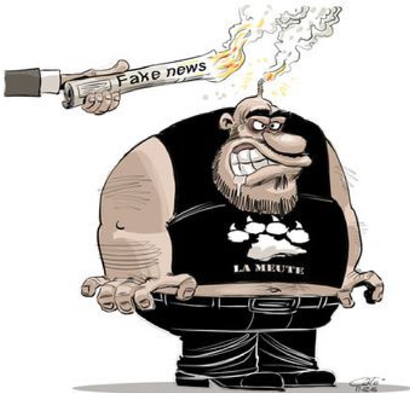
Côté, Fake News , 2017© Côté