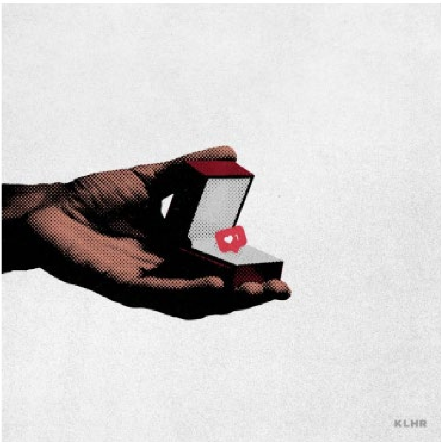
Kevin Lau, True Love (Grand Amour), 2017