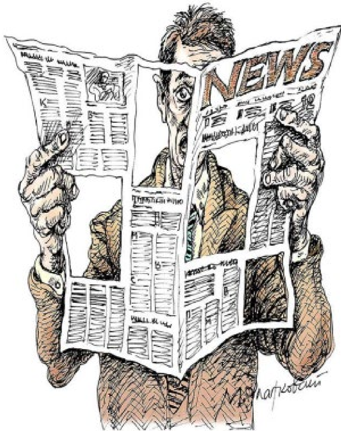
Mikhail Zlatkovsky, Empty News , 2008 © Mikhail Zlatkovsky