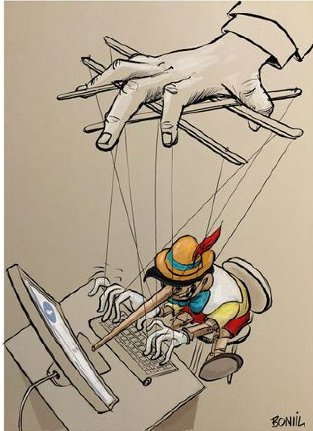
Bonil, « Fake news », paru en 2017 dans Nuestro Mundo Magazine .