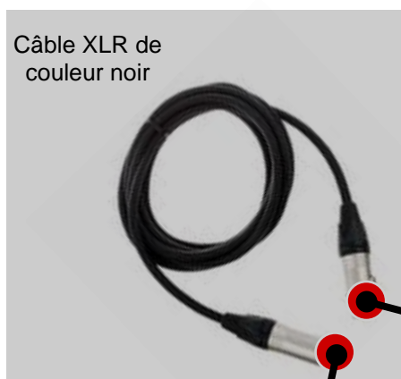
Câble XLR de couleur noir