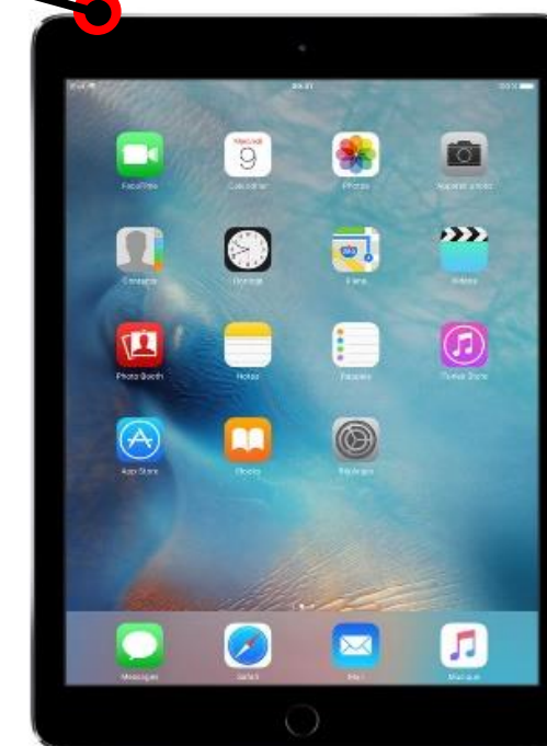
Tablette numérique 2 : Enregistrement de reportage avec application bossjock jr