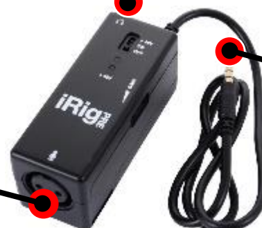
Interface XLR - Tablette numérique TRRS